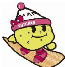
倶知安町イメージキャラクター じゃが子

北海道銀行 地域振興公務部 坂本 TEL 011-233-1096 広報CSR室 大海・西東 TEL 011-233-1005