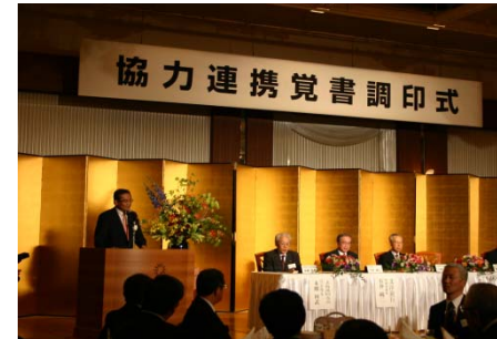
協力提携覚書調印式の様子(24/5)

平成24年5月には「北海道中小企業同友会」と、中小企業と地域経済の活力を維持発展させることを目的とした協力連携覚書の調印を致しました。同友会が主催する「人材育成サ