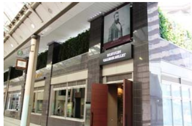
入口では、ミレーの肖像画がご来場者をお出迎えています

バルビゾン派の巨匠、ミレーをはじめとした世界的な名画を、街なかで気軽に楽しめる空間となっています。