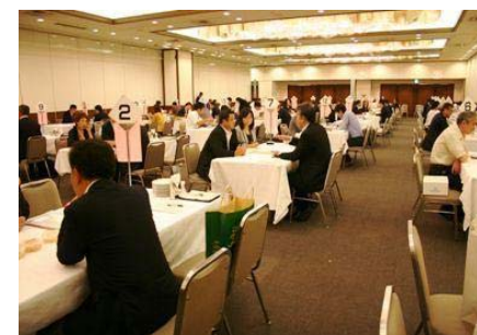
活気溢れる商談会 (24/9)

全道各地の「こだわりの物づくり」を行う食品メーカーが首都圏を中心とした百貨店等の招聘バイヤーを相手に自社商品をアピールする絶好の機会となりました。