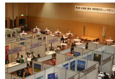
第3回北海道『観光』特別商談会from中国(24/6)