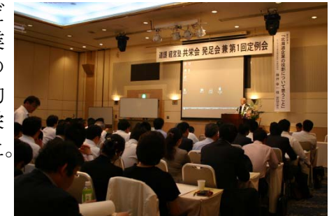
道銀経営塾共栄会 第一回定例会(24/7)

月現在）にご卒業いただいております。この卒業生の皆様の交流、一層のリレーション強化を目的とし、卒業生の会「共栄会」を設立いたしました。平成24年7月開催の第一回定例会には総勢約200名の皆様にご参加いただきました。