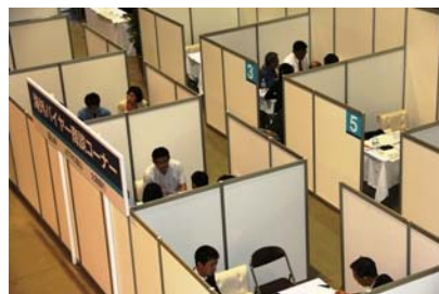
海外バイヤーとの商談ブースの様子