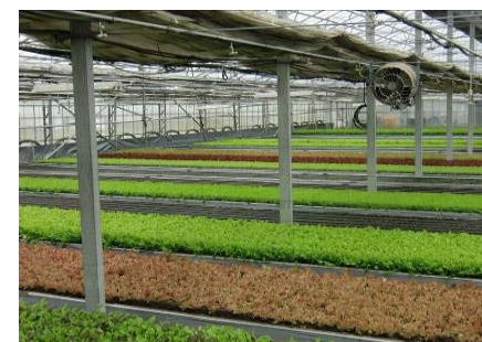
視察を実施した植物工場内の様子 (24/5)

さらに、平成24年10月には、前年に引き続き「植物工場」をテーマに「アグリビジネスフォーラム2012」を開催し、農業分野進出を検討するお客様の支援に積極的に取り組んでいます。