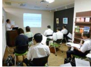
少人数制とするほか、実際にパソコンを操作していただく等、より理解を深めていただくよう工夫しました

来年より開始予定の「でんさい」は、従来の資金決済手段である手形や現金に加わる、新たな資金決済スキームとして注目されています。当行では、お取引先の利便性向上に繋がることから、24年度上半期に97回、のセミナーを開催し、述べ617社、778名のお取引先の役職員の方に、でんさいの仕組みや事務処理について、ご理解を深めていただくことができました。