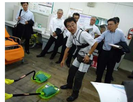
工業試験場の各設備に関する講習風景(24/9)

「北海道立総合研究機構」との連携強化のため、札幌市外支店長席39名が参加し、視察研修会を開催いたしました。工業試験場や食品加工センター等を視察し、同機構の設備や取組みに対して理解を深め、取引先のニーズ発掘・支援に活かして参ります。