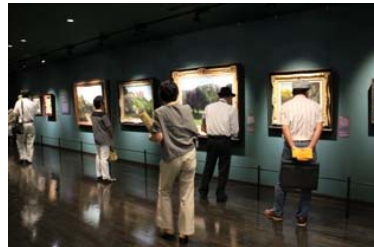
多くの方に世界的名画を楽しんでいただける空間になっています