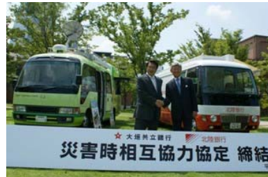
調印式では、両行の移動店舗の披露式も行われました

今後、それぞれの営業地域で災害が発生した場合、ATMなどを搭載した移動店舗を派遣するほか、営業に必要な人員の派遣や、支援物資の提供などについて相互協力して参ります。