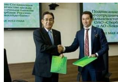
ズベルバンクとの調印式の様子(24/5)

今後も様々な取組みを通じてお取引先の様々な海外進出ニーズに応える体制を整備してまいります。