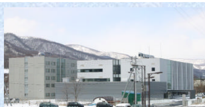
道銀ほしみ研修センター（平成21年3月開所）

上記の他、債権管理や企業支援に関する研修、北海道経済の現状と展望について「M&A基礎講座」などのステップアップセミナーも実施。平成21年3月にはこれらの研修体制充実のため、新研修センターを開所。