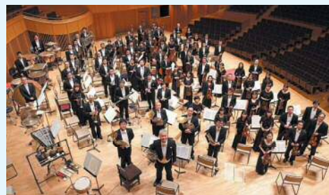
管弦楽 札幌交響楽団 Sapporo Symphony Orchestra